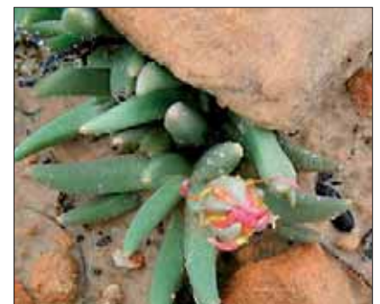
Heroea sp.

Le but du projet est de réunir en cinq ans 400 espèces dont la MSB ne dispose pas encore, y compris toutes les espèces endémiques et répertoriées