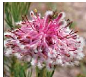
Serruria furcellata

Le Royaume Floral du Cap (CFK) est l'habitat le plus riche de la Terre sur le plan botanique. Il comprend plus de 9000 espèces, dont 70 % ne se trouvent nulle part ailleurs. C'est le seul royaume floral à se trouver entièrement sur le territoire d'un seul pays. Le CFK consiste en plusieurs types de végétation, parmi lesquels : Cape Peninsula Mountain Fynbos, Cape Flats Dunes Sandveld, Swartland Shale Renosterveld et Cape Flats Sand Fynbos.