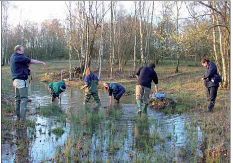
L'équipe en cours de réintroduction de D. alisma dans des mares de Greenham Common.

Une seconde tentative a été organisée en 2006 à Greenham Common, dans le Berkshire, une ancienne base aérienne. Une équipe réunissant des membres du personnel de Kew, de Plantlife, de Natural England et des conseils régionaux du West Berkshire et du Buckinghamshire, ont entrepris le travail de plantation. Une autre méthode a été adoptée à Greenham Common, où les boutures ont été plantées sur les bords de deux mares. Les semences ont ensuite été semées directement dans le sol à deux autres