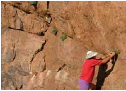
Collecte de Rogeria petrophila en Namibie

un équipement adéquat. Le MSBP a formé près de 1200 personnes en matière de conservation des semences et a fourni une assistance technique et de meilleures installations à nos partenaires de collecte, ce qui a fortement contribué à l'objectif 15 de la SMCP. Le programme scientifique et technologique de MSBP