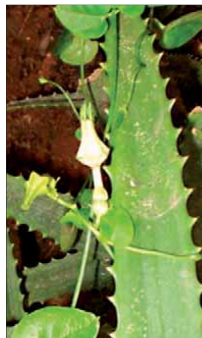
Ceropegia sp cf C. lugardiae ex Khama Rhino Sanctuary