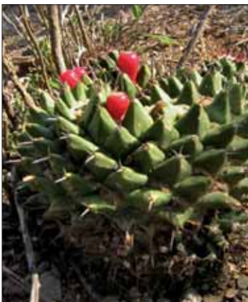
Mammillaria polyedra

En conclusion, il est important de souligner que les guides de collecte sont désormais un outil particulièrement précieux pour améliorer la collecte d'espèces ciblées, en vue du stockage de semences à long terme, en particulier compte tenu des changements rapides de la végétation et des pertes actuelles connues en termes de biodiversité.