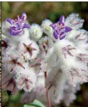
Hyptis laniflora