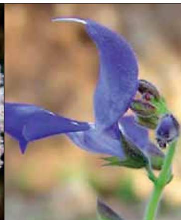
Salvia cacaliifolia

Pour tous renseignements complémentaires, veuillez contacter : Oswaldo Tellez FESI-UNAM tellez@servidor.unam.mx