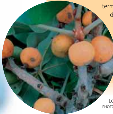
Left: Fruits murs de Oldfieldia dactylophylla

L'équipe du MSBP a récolté une bonne partie de ces précieuses semences en vue de leur conservation ex situ pour le long terme. L'équipe du Malawi a soumis les semences à divers essais de germination. Jusqu'à présent, toutes les méthodes de germination ont échoué, ce qui indique que les semences nécessitent des conditions spéciales pour que la germination se produise. Ceci pourrait partiellement expliquer pourquoi elles sont si rares dans la forêt. Jusqu'à présent, l'équipe du Malawi a recueilli 16 % des espèces répertoriées sur la liste rouge ; soit 33 des 206 espèces au total.