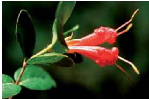
Lambertia orbifolia subsp. orbifolia

Une approche intégrée à la conservation a été adoptée par le Department of Environment and Conservation (DEC), la principale agence gouvernementale responsable de la flore en Australie Occidentale. La première étape de ce processus est l'identification des taxons d'importance en matière de conservation. Chaque année, le DEC produit la Declared Rare and Priority Flora List d'Australie Occidentale qui répertorie ces taxons. La « Declared Rare Flora » regroupe les taxons jugés rares, menacés d'extinction ou qui nécessitent une protection spéciale. Ces taxons sont protégés en vertu des lois de conservation de l'Australie Occidentale. La « Priority Flora » réunit les taxons qui sont actuellement mal connus (insuffisamment documentés) ou rares, et dont certaines populations sont potentiellement en danger d'extinction. Les informations pertinentes à ces taxons sont enregistrées sur la Florabase ( http://florabase.calm.wa.gov.au ), et comptent des données sur les espèces d'herbier et des données connexes sur les emplacements géographiques.