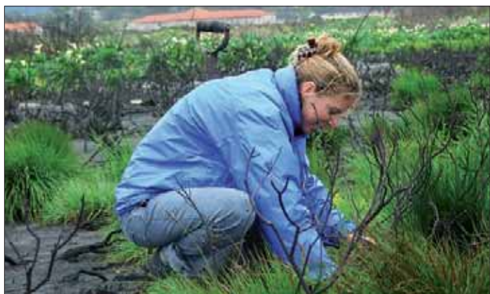
Planting Ericas

SANBI, Kirstenbosch Botanical Gardens Cowell@sanbi.org