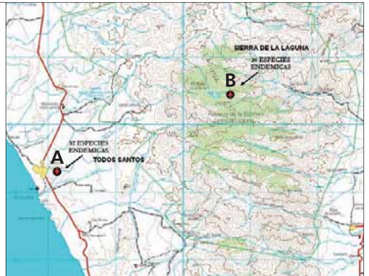
Les emplacements où certaines espèces ciblées peuvent être trouvés ensemble sont illustrées sur les itinéraires de collecte suggérés.

Jusqu'à présent, ceci a permis la sélection d'espèces pour trois guides : 1) Sierras de Taxco et Huautla, 2) Sierra Gorda-Río Moctezuma et 3) Péninsule de Baja California. Ces guides comptent pour le moment environ 500 espèces de plantes vasculaires des régions arides. Un quatrième guide sur la vallée de Tehuacan-Cuicatlán est en cours d'étude. Cette région unique est la zone semi-aride la plus au sud d'Amérique du Nord.