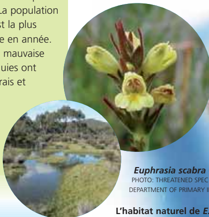
Euphrasia scabra (Yellow Eyebright)