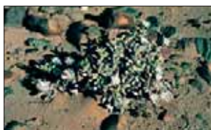
Juttadinteria albata – une espèce menacée qui fait partie d'un programme de restauration.

La plus grande population de la succulente vulnérable [VU A3c+4c ; D2], Juttadinteria albata , se trouve dans une zone qui sera bientôt exploitée par la NAMDEB. Le partenariat vise à étudier des moyens d'atténuer les effets de l'exploitation minière sur le Juttadinteria albata et à assurer sa réhabilitation ultérieure dans la région. Le MSBP contribue par le biais de collections et par la conservation de semences ainsi qu'en offrant son aide lors des essais de propagation réalisés aux jardins botaniques nationaux et d'autres