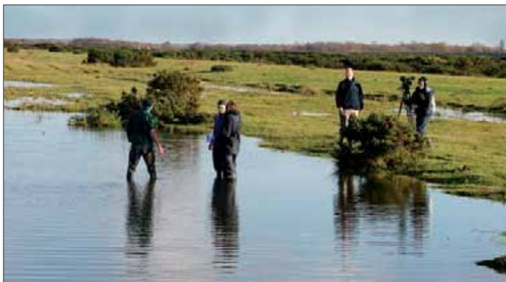
L'équipe en cours de réintroduction de D. alisma dans des mares de Greenham Common.