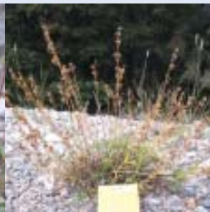
Penstemon rostriflorus en fruit