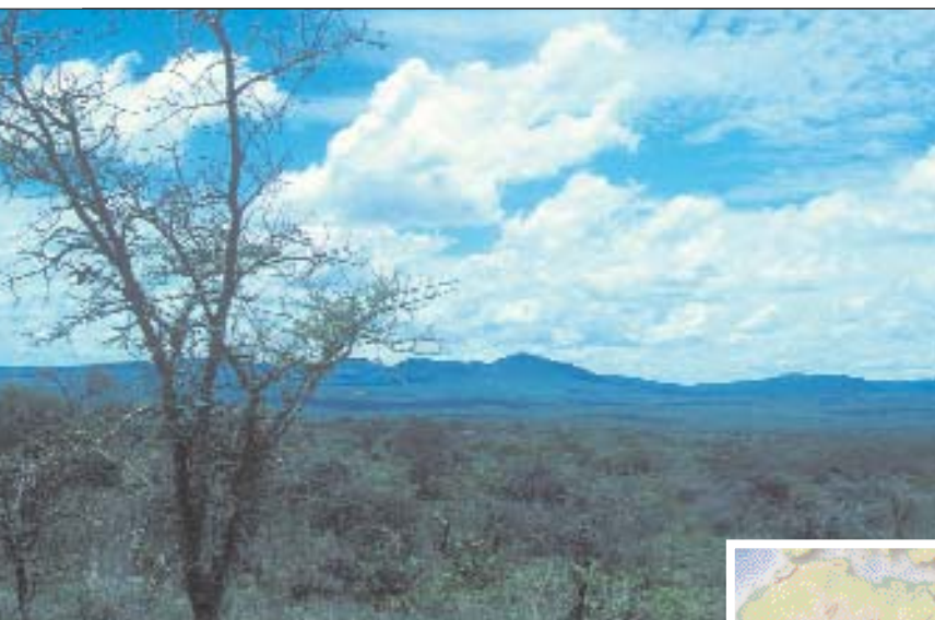
A gauche: Végétation de buissons épineux secs .

Comme la première phase de trois ans du projet Seeds for Life au Kenya tire à sa fin, nos équipes de collecte ont eu un peu de temps pour réfléchir aux points forts du travail de collection et pour organiser la transition à une méthode d'approche plus spécifique de notre programme.