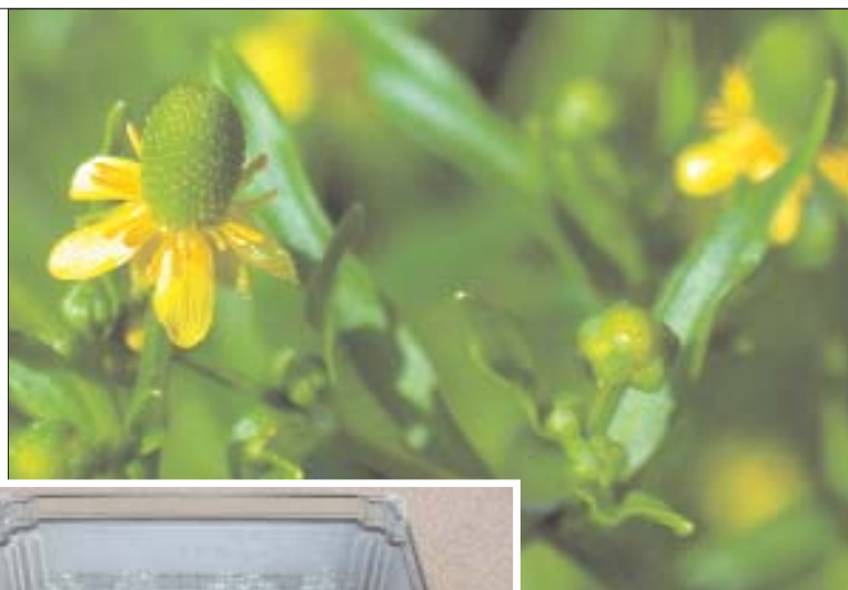
Ci-dessus: Ranunculus sceleratus : espèce de référence de courte durée utilisée dans les études de longévité comparative de MSB.

Quelle que soit la méthode adoptée, il est certain que relativement peu d'espèces de plantes sauvages ont été étudiées en détail. Même si les résultats des analyses de re-test de la viabilité de MSB sont réconfortants, nous ne savons tout simplement pas quelles espèces sont fondamentalement de longue ou de courte durée. Ainsi, l'un des défis scientifiques les plus importants pour MSBP était de mieux comprendre, dans les délais les plus brefs, les variations d'une espèce à l'autre en matière de longévité des semences. Prélevant des échantillons de semences directement des collections, la méthode devait être économique dans son usage des