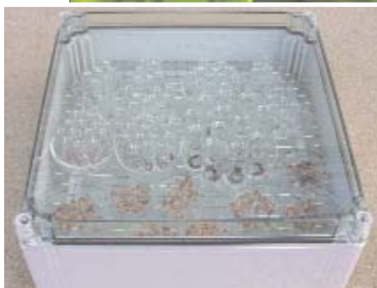
A gauche: Gros plan d'échantillons dans un récipient hermétique.