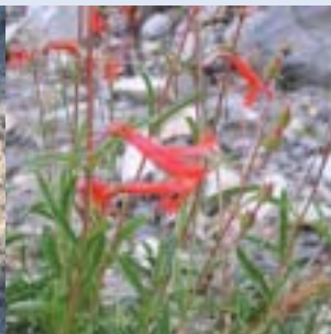
Penstemon rostriflorus en fleur