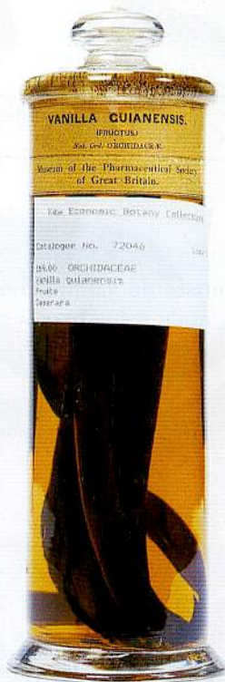
6 – Le plus vieil échantillon de la collection, gousses de Vanilla guianensis Splitg., datant de 1849 (Economic Botany Collections [EBC] 72046).

Seuls 2 échantillons sont étiquetés sous ce nom. Ils proviennent de Demerara (Guyane), et l'un des deux, composé de gousses (voir FIG. 6), est le plus ancien