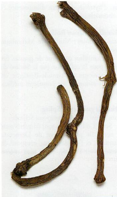
7 – Tronçons de tiges de Vanilla madagascariensis Rolfe (EBC 73443).

échantillon de la collection de vanille, datant de 1849! L'autre comprend des fruits, une tige et une feuille conservés dans de l'alcool.