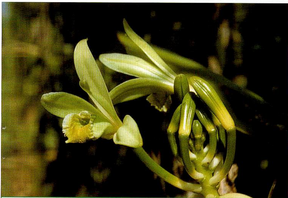
3 – Fleurs de Vanilla planifolia Andr.

C'est grâce à la fécondation que sont obtenues les gousses (voir FIG. 9). L'autofécondation est impossible en milieu naturel à cause d'un rostellum très prononcé séparant l'unique anthère du stigmate. Mais elle peut être réalisée manuellement en relevant le rostellum et en abaissant ensuite l'anthère sur le stigmate. Cette opération est, par tradition, effectuée à l'aide d'une épine de citronnier ou d'une pointe de bambou grâce à l'ingénieuse idée d'Edmond ALBIUS. Puis les gousses sont cueillies vertes pour être échaudées dans de l'eau à 65 °C pendant 3 minutes afin d'arrêter les réactions enzymatiques. Elles sont ensuite étuvées pendant 12 à 14 heures avant d'être séchées au four, au soleil et à l'ombre, triées, calibrées et enfin conditionnées pour être finalement vendues dans le commerce.