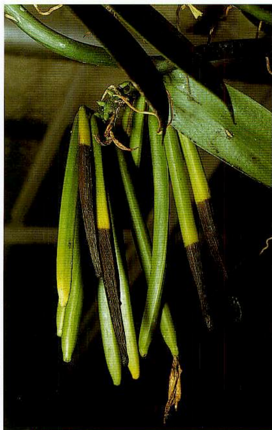
4 – Gousses vertes de Vanilla planifolia Andr.