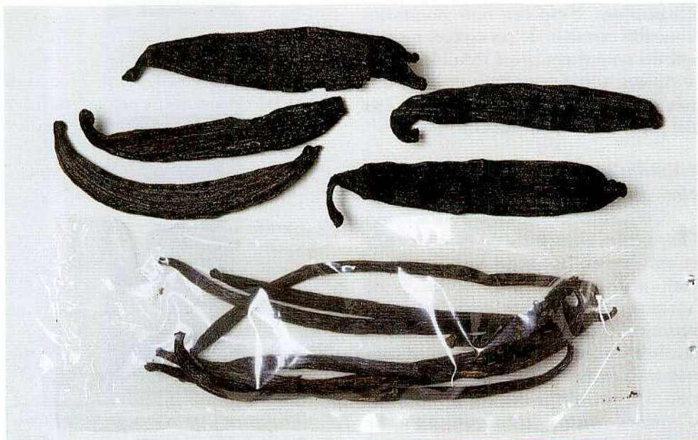
8 – Cousse de Vanilla pompona Schiede (EBC 37250) et de Vanilla planifolia Andr. (EBC 29270).

Cette espèce est l'une des 4 poussant naturellement sur l'île. L'échantillon, formé par des internœuds de tige, est le plus récent (1995) et provient de Madagascar (voir FIG. 7). Elle posséderait en plus des propriétés médicinales du genre, des propriétés aphrodisiaques. En effet la population locale réa-