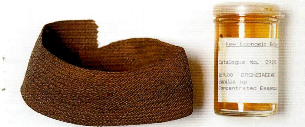
9 – Concentré d'essence de vanille (EBC 29293, à droite) et Bracelet (EBC 29290, à gauche) réalisé à partir de racines tressées d'une vanille de l'ouest de l'Afrique tropicale.

lise à partir de la tige bouillie avec deux écorces d'arbres (dont Cedrelopsis ) un thé à la vertu aphrodisiaque. Sur l'étiquette de l'échantillon est d'ailleurs mentionnée la rapidité de l'effet de cette décoction!